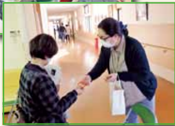
受講された参加者様には、認知症サポーターの証として「オレンジリング」が渡されました