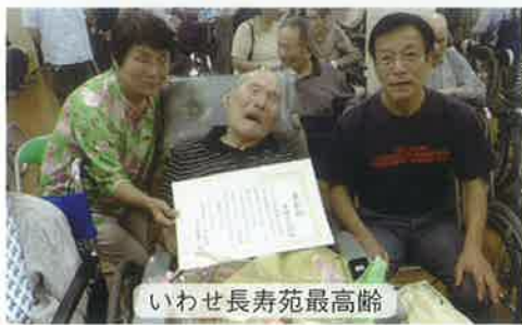
いわせ長寿苑最高齢

お集まりいただいたご家族様、ご来賓の皆様、心より感謝申し上げますとともに、これからも一緒に年月を重ね、また来年も一緒に笑いながら祝えるようお祈りしております。